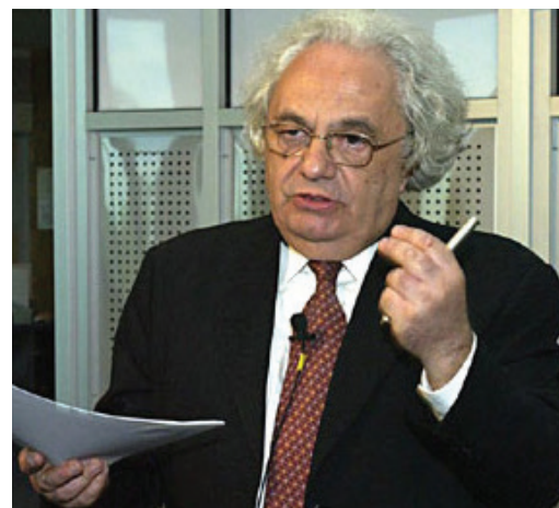
Cioran, Edgar Morin și Raimond Abellio.